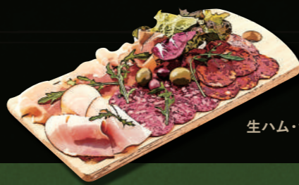
生ハム・サラミの盛り合わせ

コベルト(席料)といたしまして、お一人様 ¥300(税込330)を頂戴しております。 There is an additional cover charge of ¥330 per adult, including consumption tax. ※カッコ内は税込価格です。Prices in parentheses include tax.