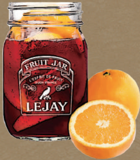
生カシオレ Fresh cassis orange