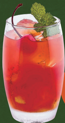
24 トロピカルシャイン Tropical shine