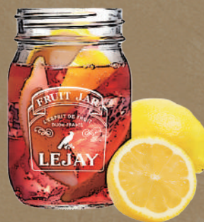
ストロベリーレモネード Strawberry lemonade