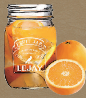
バナナ生オレンジ Banana fresh orange soda