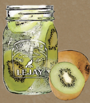
洋梨キウイスパークリング Pear kiwi sparkling