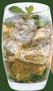
25 バージンモヒート Virgin mojito