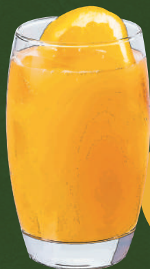
22 オレンジサンライズ Orange sunrise