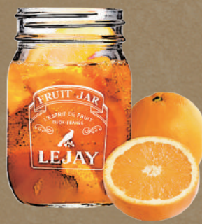
アプリコット生オレンジ Apricot fresh orange sparkling