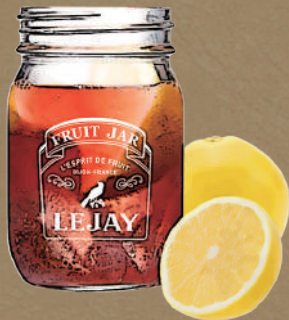
フランボワーズ生グレーフル Framboise grapefruit