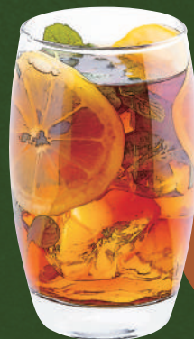
23 ボタニカルレモンティー Botanical lemon tea