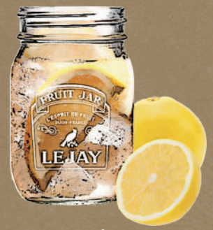
Wグレープフルーツ Double grapefruit