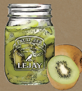
グリーンアップル生キウイ Green apple fresh kiwi soda

「ルジェ」は、フランス・ブルゴーニュ地方でつくられるフルーツリキュールのブランド。 フレッシュフルーツと「ルジェ」を合わせた最旬カクテルをオシャレな専用ジャーで。