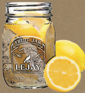
Wレモン Double lemon