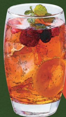
26 ベリーサワー Berry sour