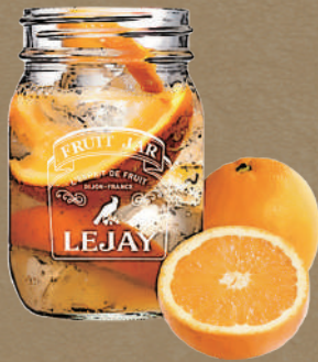
生ファジーネーブル Fresh fuzzy navel